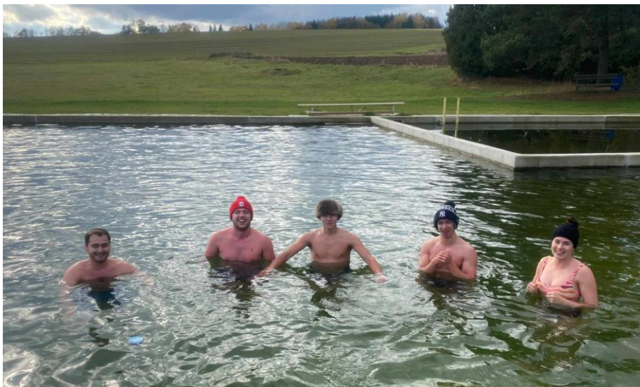
Po svatém Martinovi, kdy všichni byli přecpaní husou a knedlíky, si zašli otužili v neděli 12. 11. na plovárnu, aby se trochu rozhýbali.

A proto otužilcům přeji odvalu a pevnou vůli a heslo zní: „Ve zdravém těle – zdravý duch.“ Věřím, že do budoucna další přibudou.