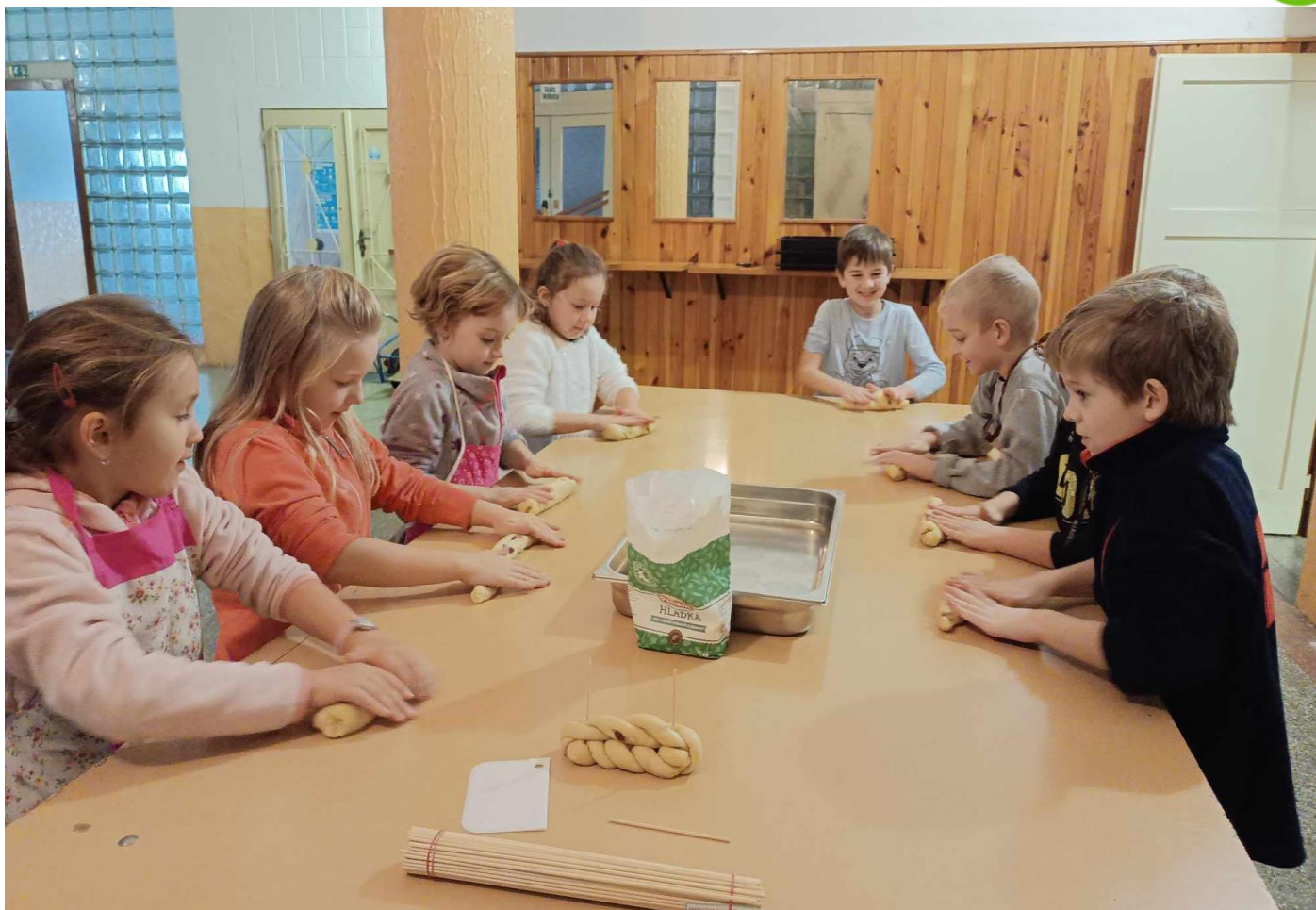
Školáci pečou vánočky.